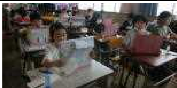
【テンポよく音読に取り組む2年生】