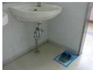
【北校舎トイレ スリッパの様子】

うれしいことにトイレのスリッパがそろい始めました。最もそろえにくい場所であるにもかかわらずです。北校舎のトイレはスリッパがなかなかそろわなかった場所ですが、今はこのように並ぶことが多くなりました。子どもが育っています。